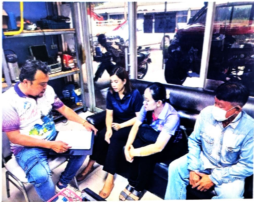
ภาพประชุมผลตรวจสอบการดำเนินการตามมาตรการป้องกันการละเว้นการปฏิบัติหน้าที่ในการบังคับใช้กฎหมายเกี่ยวกับป้ายโฆษณา