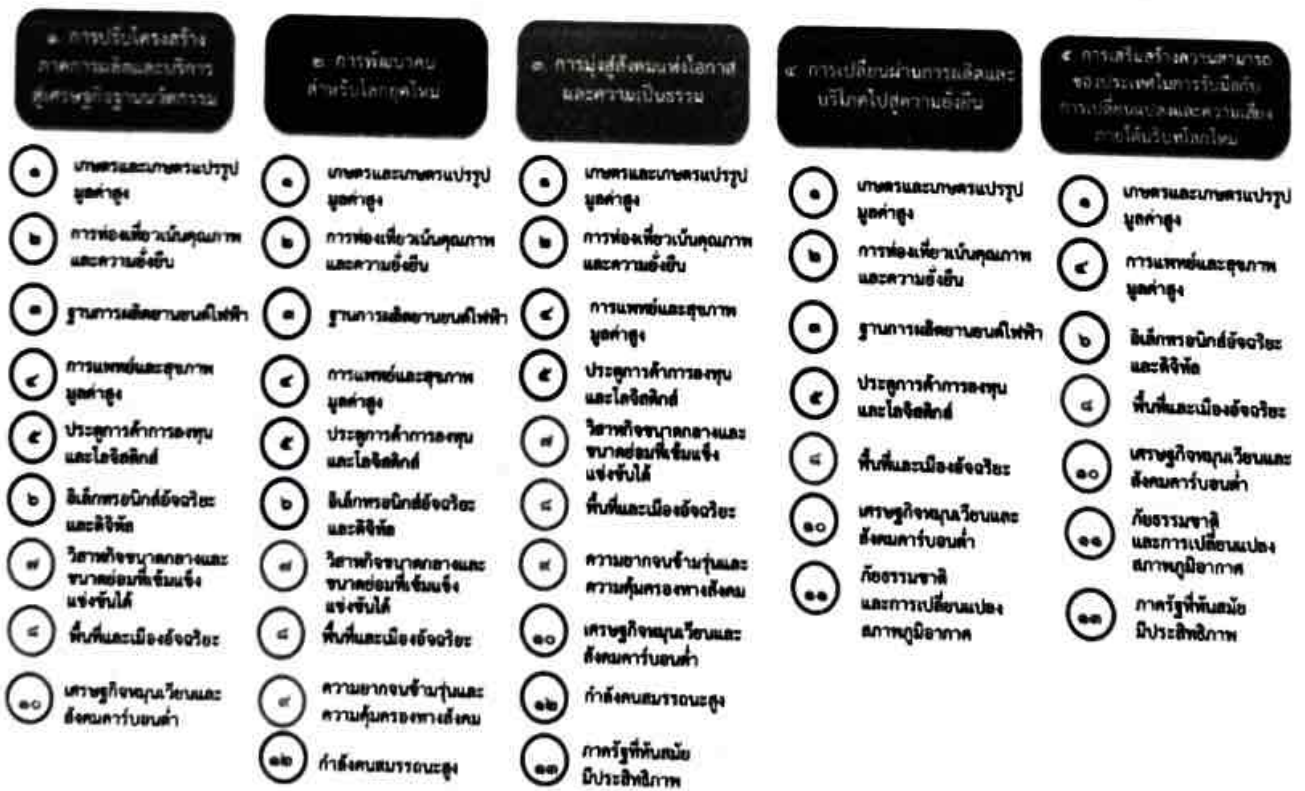
แผนภาพที่ ๓.๑ ความเชื่อมโยงระหว่างหมวดหมู่การพัฒนาที่เป้าหมายหลัก

ความเชื่อมโยงระหว่างหมวดหมู่การพัฒนาที่เป้าหมายหลักแสดงไว้ในแผนภาพที่ ๓.๑ โดยหมวดหมู่ การพัฒนาที่กำหนดขึ้นเป็นประเด็นที่มีลักษณะเชิงบูรณาการที่ครอบคลุมการพัฒนาตั้งแต่ในระดับต้นน้ำ จนถึงปลายน้ำ และสามารถนำไปสู่ผลพัฒนาทั้งในมิติเศรษฐกิจ สังคม ทรัพยากรธรรมชาติและสิ่งแวดล้อมไป พร้อมๆ กัน ทำให้หมวดหมู่แต่ละประการสามารถสนับสนุนเป้าหมายหลักได้มากกว่าหนึ่งข้อ นอกจากนี้ การพัฒนาภายใต้แต่ละหมวดหมู่ไม่ได้แยกขาดจากกัน แต่มีการสนับสนุนหรือเอื้อประโยชน์ซึ่งกันและกัน